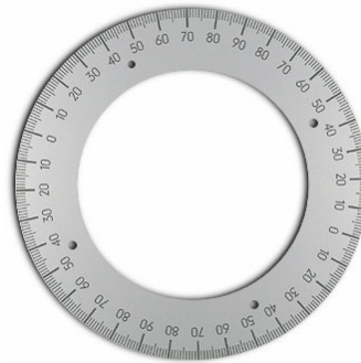
Skalen, Lineale, Maßstäbe, Peilstäbe

Beschriften Sie Ihre Skalen mit Informationen – oder Ihrem Logo!